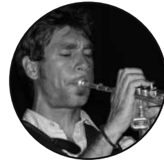
TROMPETTE . HARMONICA Bertrand Rocksteady Sporting Club My Own Klub / Groovin Factory Yaourt Soul Experience