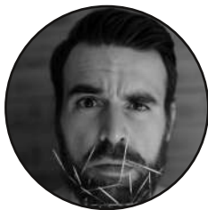
CHANT . JB Valiente Spool Section / Next Train

Beuh ? Les cuivres croient jouer de la soul, le chanteur est convaincu que c'est un groupe de blues, la choriste aime le disco, le guitariste n'apprécie que le rock, le bassiste et le batteur pensent qu'ils jouent du funk, le clavier, de l'électro New Beat... Personne ne voulant froisser personne, ils parviennent à s'entendre (très bien) pour créer un Carry Soul, ou presque , un univers bien à eux qu'ils aiment partager sur scène.