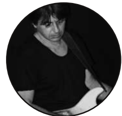
GUITARE . Nat Kombo Mummy Wata / Markousov Anamorphose / The Marbels