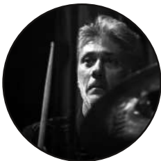
BATTERIE . Gweg KGB / Yaourt Soul Experience Jeahy