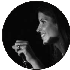
CHANT . Claire Bee KGB / Yaourt Soul Experience