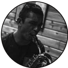
SAX BARYTON . Heri Tontons Fonnker Le Bruit de la Passion