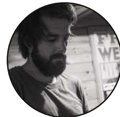
CLAVIERS . Greg Rocksteady Sporting Club